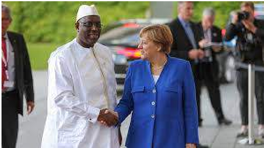
La chancelière Dr. Angela Merkel et le Président Macky Sall

La chancelière allemande, Angela Merkel veut inciter les grands dirigeants du monde à plus investir en Afrique.