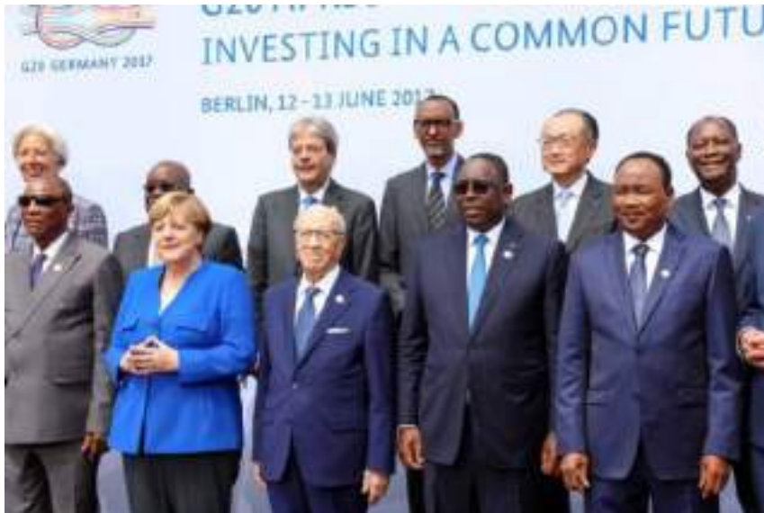
Michelle Lagarde et la chancelière Angela Merkel avec les présidents africains .Berlin 12 juin 2017 « G20 investir dans un avenir commun

millions de dollars, 20 Milliards de francs CFA) d'aide supplémentaire aux 3 pays qui sont considérés comme «champions des réformes ».